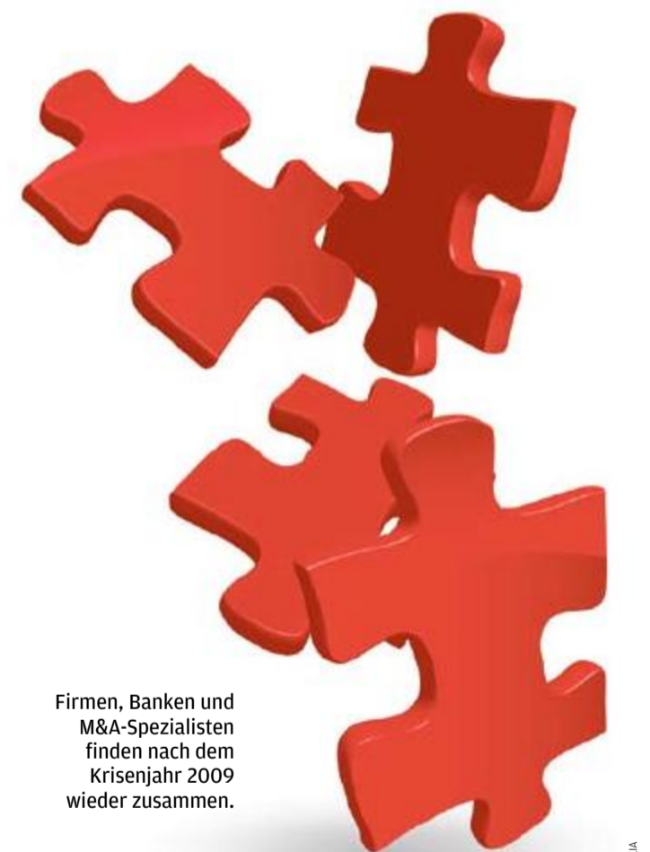
Firmen, Banken und M&A-Spezialisten finden nach dem Krisenjahr 2009 wieder zusammen.